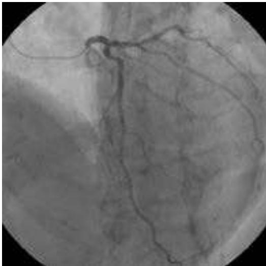
図 1. 旧装置で撮影した画像

装置更新後、画質評価に関してはまだ測定等は行っていない。しかし、画像の変化は明確である。同一患者で両装置にて検査を行っている方がいたので、同じ角度で撮影した画像を比較する。微細血管の描出や画像の粒状性の違いがわかると思う（図1、図2）。