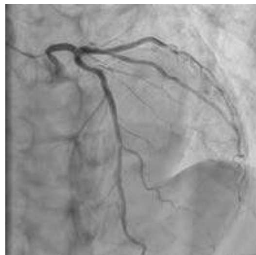
図 2. 新装置で撮影した画像

線量評価に関しては、装置基準透視線量率の測定を行い DRL 値との比較を行った。装置更新時に透視パルスレート等の見直しを行い、測定は各装置において使用頻度の高い条件で行った（表1）。