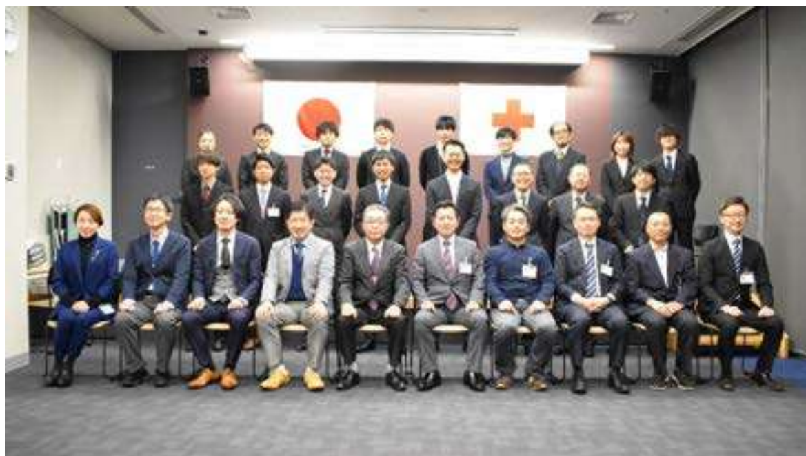
研修会終了後の記念撮影