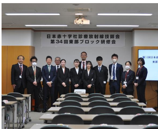
2024年日本赤十字社診療放射線技師会東部ブロック研修会

当院の放射線科は、世代や担当のモダリティにかかわらずスタッフ同士の距離が近く、明るく話しやすい雰囲気職場です。日頃から気軽に質問や相談ができ、知識や経験を共有し合える環境が整っていると感じています。また、放射線科医との連携も大切にしており、放射線科医と技師で定期的にミーティングや勉強会を行っています。適切な撮影方法や画像読影について学べる機会が多く、専門性を高めながら業務に取り組むことができています。