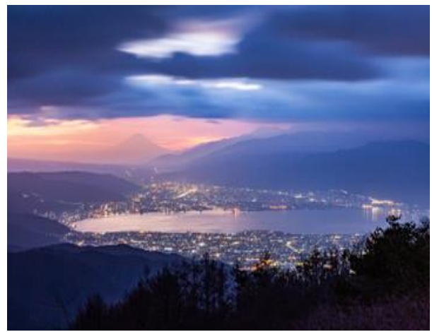
立石公園からの諏訪湖