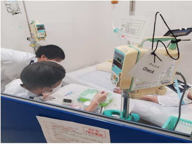
ルタテラ静注の準備