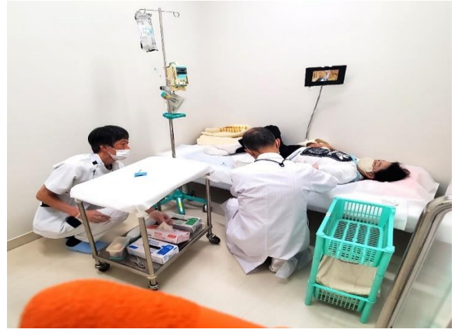
放射線治療医による抜針