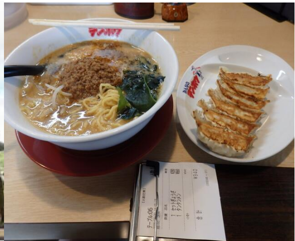
タンタンメンとぎょうざ