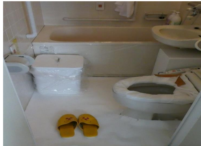
養生したトイレ周囲