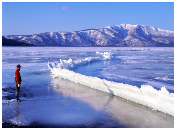
諏訪湖の御神渡り